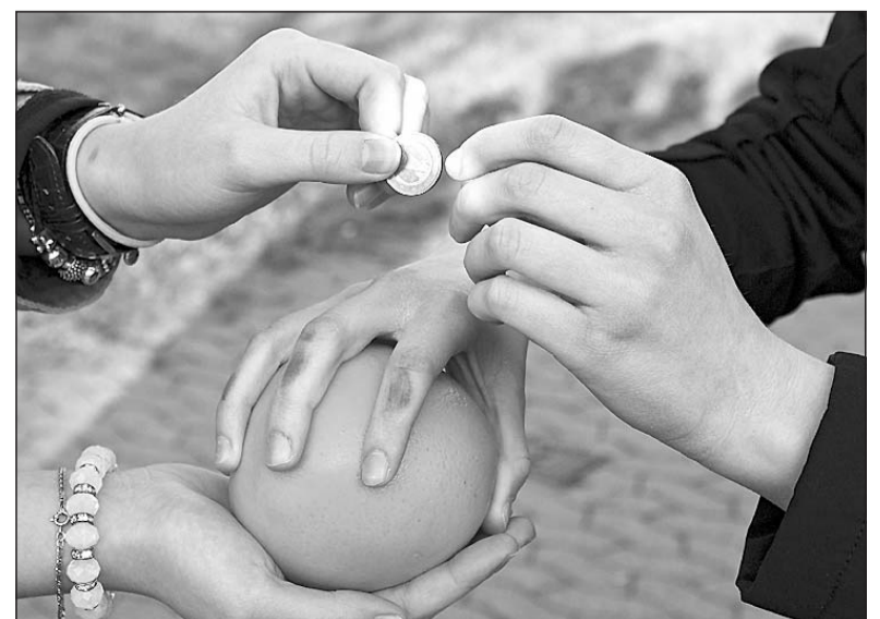
Fotograf Jürgen Escher begleitete die Berufsschüler des Anna-Siemsen-Kollegs bei ihren Vorbereitungen für die Aktion. Dabei entstand auch diese kunstvolle Aufnahme tauschender Hände.

mut in Herford vertraut. Außerdem hielt Fotograf Jürgen Escher die Vorbereitungen der jungen Leute für den Tauscheinsatz mit seiner Kamera fest.