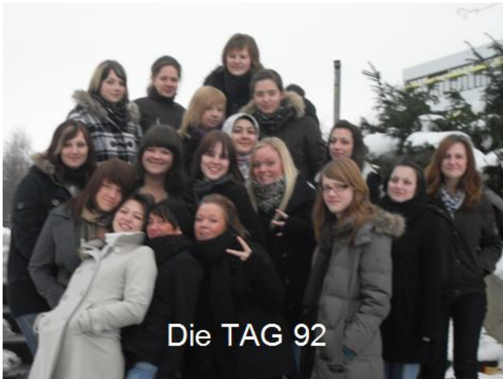
Die TAG 92